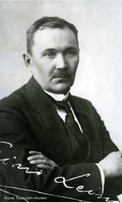
ITSENÄINEN SUOMI 1917